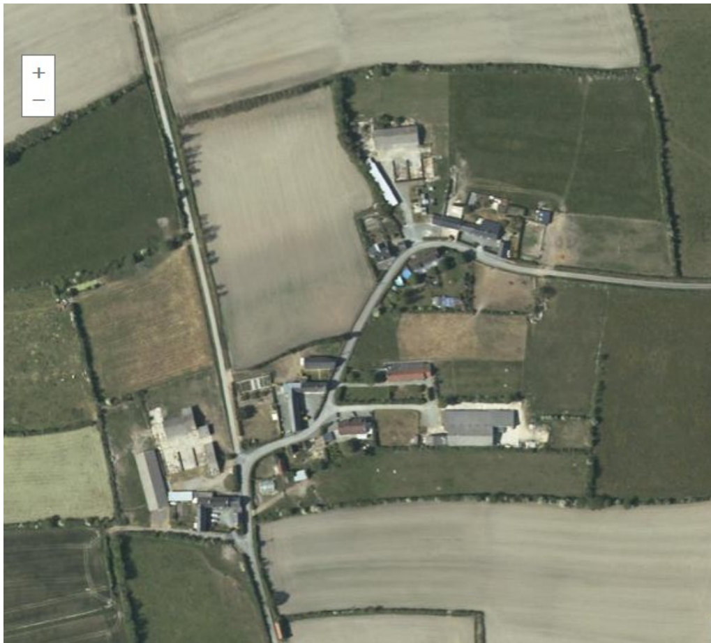
Vue aérienne de la Coubrunière

La Coubrunière est un hameau situé à 1 km au nord de la Vallée , le bourg de Geffosses. Il est constitué d'une dizaine de maisons pour la plupart anciennes et de bâtiments ruraux.