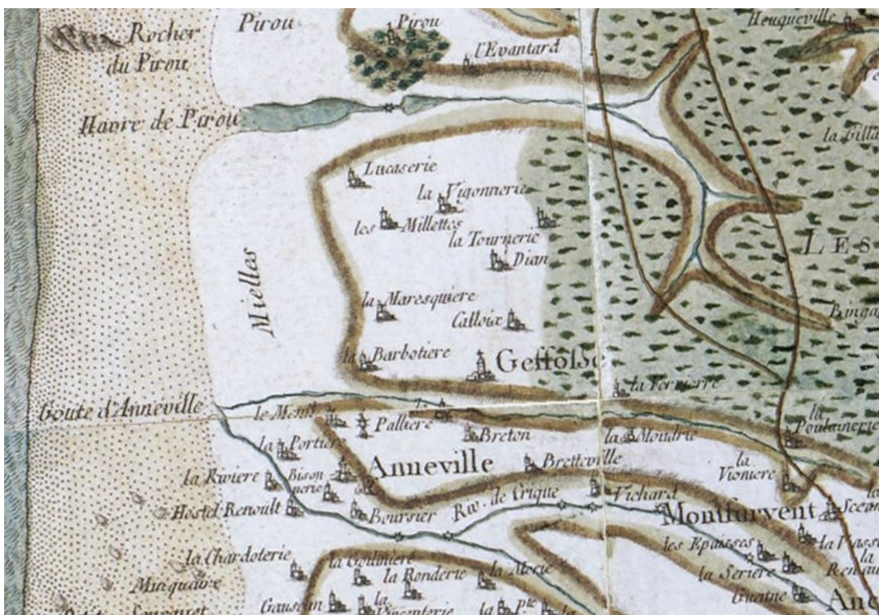
Carte de Cassini

La carte de Cassini de la région de Coutances levée en 1756 et publiée en 1759 est la plus ancienne carte fiable dont nous disposons. A Geffosses, sont situés, les villages où lieu-dits de la Maresquiere , la Barbotiere , la Palliere , Breton , Bretteville , Vichard , la Mondrie qui existent encore avec le même nom. Trois autres sont plus difficile à identifier : la « Ferrierre », Calois et Dian qui d'après les anciens états le nom donné à l'Hôtel Doyen . En 1756, la partie Est de la paroisse, grossièrement à l'Est de la route qui va de Canteloup à la Terrerie était encore couverte de landes.