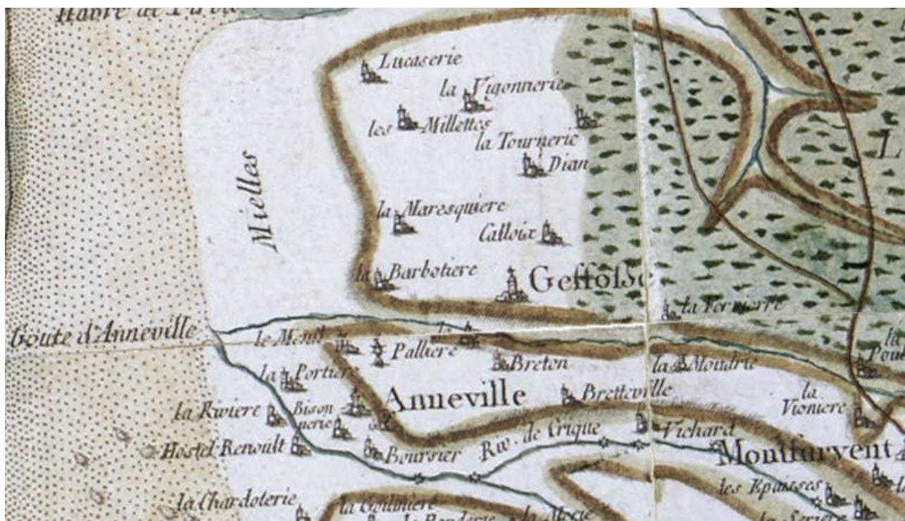
Carte de Cassini

La carte de Cassini de la région de Coutances levée au début des années 1700 est la plus ancienne carte fiable dont nous disposons. A Geffosses, les villages cités sont la Maresquière, la Barbotiere, la Palliere, Breton, Bretteville, Vichard, la Mondrie qui devient La Monderie après 1800. Trois autres sont plus difficile à identifier : la « Ferrierre », peut-être la Terrerie, Calloix et Dian qui d'après les anciens est L'Hôtel Doyen. En 1756, la partie Est de la paroisse, grossièrement à l'Est de la route qui va de Canteloup à la Hervure était encore couverte de landes