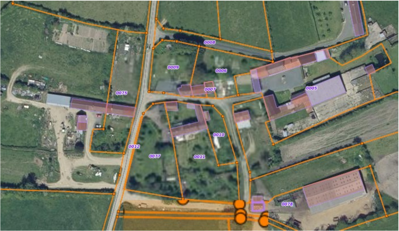
Photo aérienne 2019 et cadastre rénové de 1960