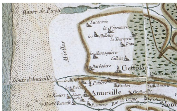
Carte de Cassini

La carte de Cassini, dont les levées ont été réalisées entre 1756 et 1789, fait référence à la Marequière , à Dian qui était l'ancien nom de l'hôtel Doyen . Il faut noter qu'entre Pirou et Anneville , il n'y avait que des mielles, le havre de Geffosses s'est constitué dans les années 1820 par la déviation de la rivière qui alimentait le havre de Pirou, ce qui a agrandi la goutte d'Anneville