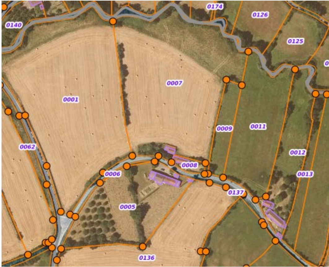
Geoportail (2024) vue aérienne et cadastre