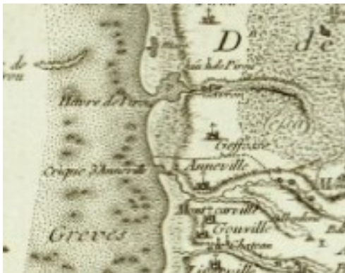
Carte de l'évêché de Coutances 1689

Difficile de voir l'ancien petit port de Geffosses sur les cartes de 1689 et de 1750. Il existe un havre à Pirou alimenté par la rivière le Sursat situé au niveau de la Bergerie et une entrée de la mer dans la crique ou goute d'Anneville. Entre les deux, il n'y a que des mielles.