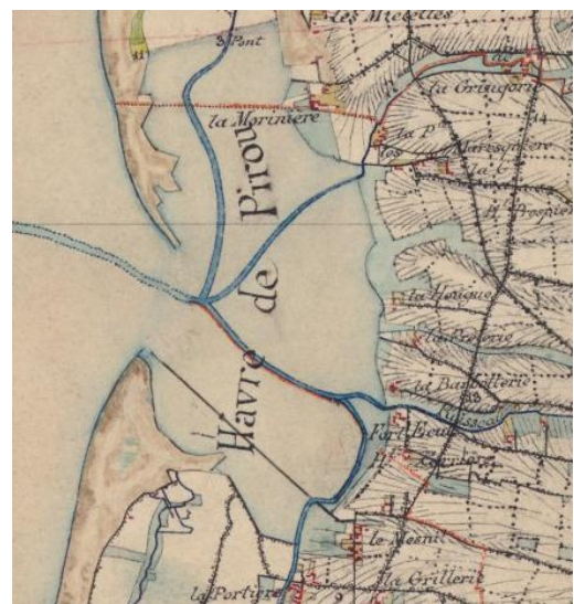
Carte d'État major 1860

Dans les années 1800 Huguet de Semonville, dernier Seigneur de Pirou fait construire une digue qui part de la Grande Maresquiere et va d'Est en Ouest jusqu'à la mer. Aux travaux de construction de cette digue s'est ajouté à la même époque une déviation vers le sud du Sursat (Gavron) qui alimentait le havre de Pirou qui s'en est trouvé asséché. Ce ruisseau coule maintenant, parallèlement à la route touristique. Ce détournement du Sursas va avoir un effet chasse d'eau, agrandir la goutte d'Anneville. Sur le cadastre Napoléonien des années 1822, le havre est encore qualifié de ' marais à tange '. Il faudra attendre les années 1900 pour qu'il prenne le nom de Havre de Geffosses .