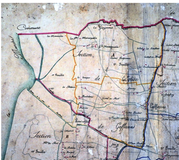
Cadastre de 1822