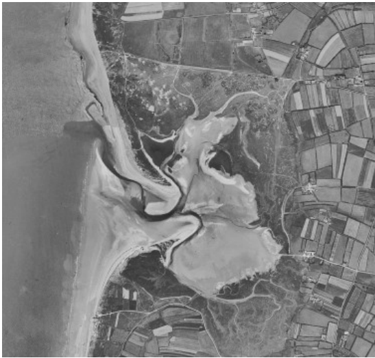
Photo aérienne 1950