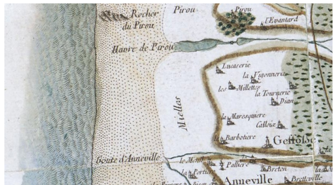
Carte de Cassini (1750)