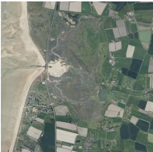
Photo aérienne années 2000