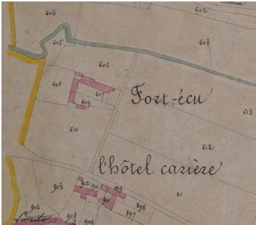
Vue partielle de la section A du cadastre Napoléonien (1812)

Les biens bâtis de Fort Ecu sont situés sur les parcelles A607 et A609. Le Jardin dont parle G. Fourey correspond à la parcelle A608.