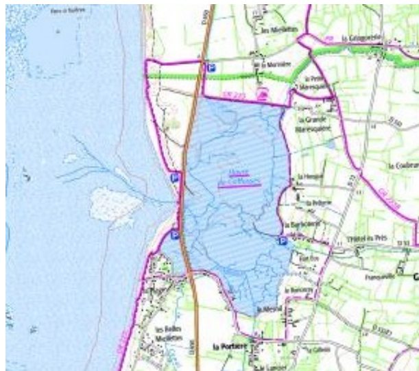
Carte IGN années 2000