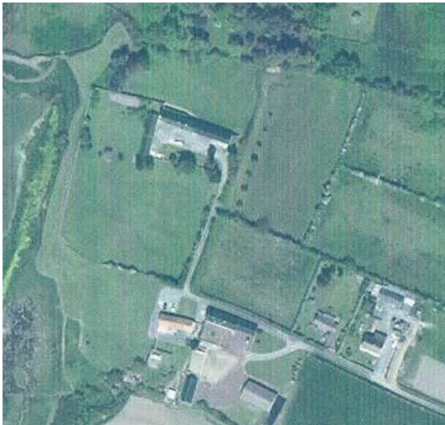
Vue aérienne de Fort Ecu et de l'Hôtel Carrière.